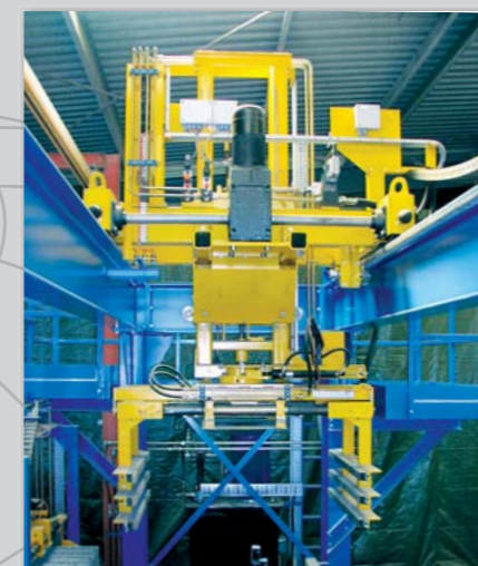
Palleteringsautomat med servo-styrede bevægelser.

fibro intercon's kvalitetsforme er udført som en sammenboltet konstruktion, for let udskiftning af sliddele. Alle sliddele er fremstillet i hærdet specialstål med stor slidstyrke.