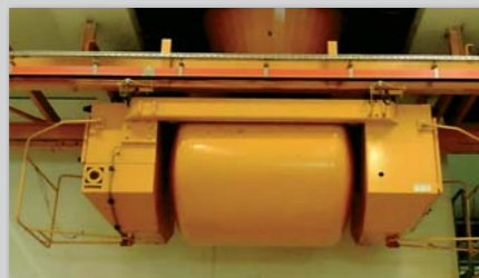
To-skinnet betonconveyor med rotationstømning.

Betonkran med drejelig betonspand, som desuden kan sænkes og anvendes til udlægning og afretning af betonen.