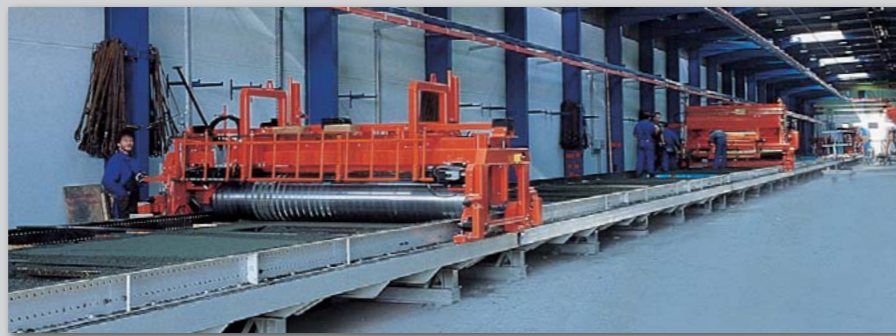
Produktionshal for letbeton vægelementer.

Udlæggermaskine for letbetonelementer udstyret med hydrauliske spjæld og automatisk styret betonafskraber.