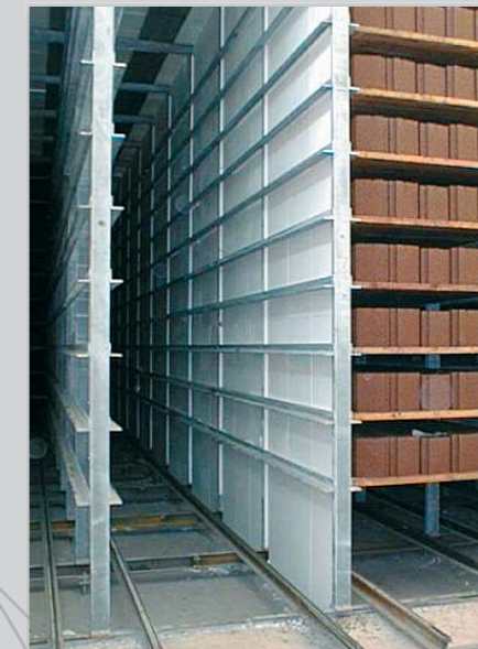
Hærdekammersystem i galvaniseret udførelse.