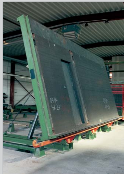
Kipstation med færdigt vægelement.