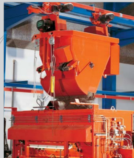
Én-skinnet, nedsænklig conveyorspand med bundopluk.

Formtransport til og fra hærdekammer kan udføres med automatkran eller rullebanesystem kombineret med elevatorer.